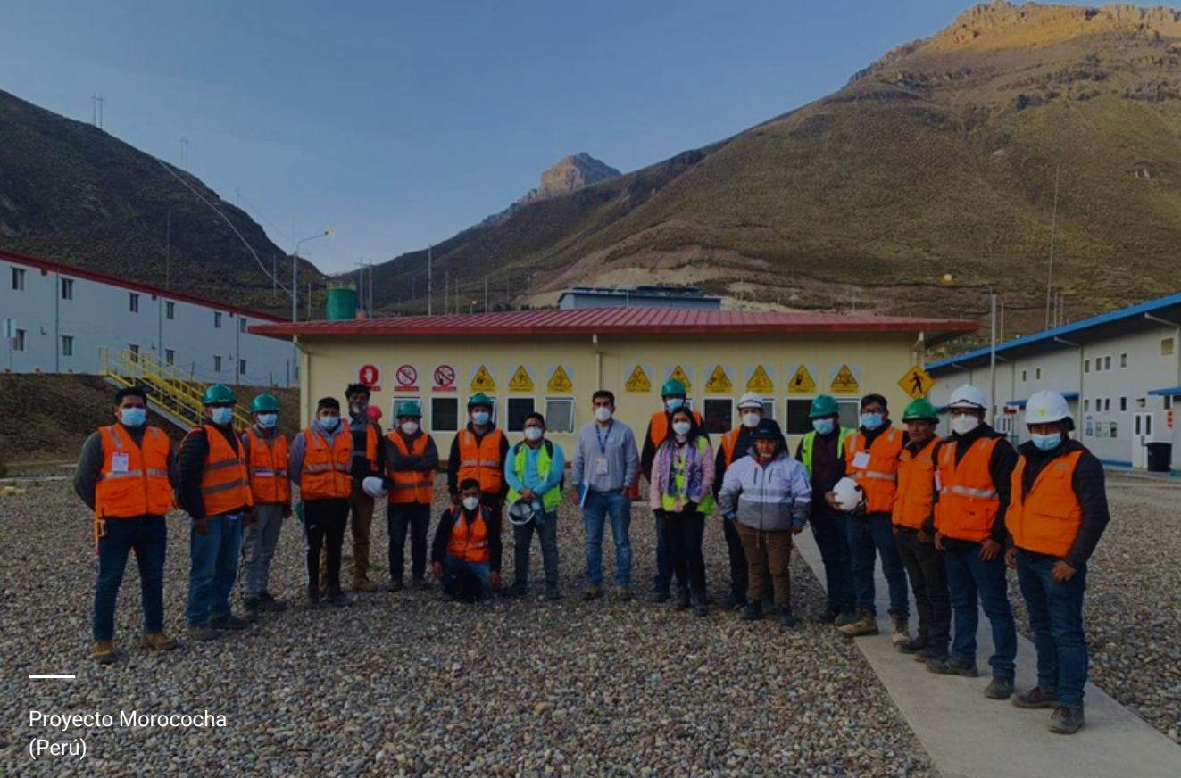
Proyecto Morococha (Perú)